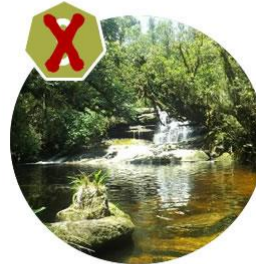
Trilha do Rio Bonito - Cunha/SP 07/03