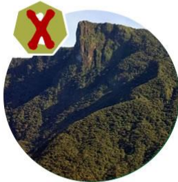
Pico do Corcovado - Ubatuba/SP 10/01 - 11/01