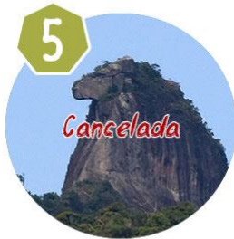
Pico do Papagaio - Ilha Grande/RJ 23/05