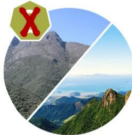
Pico dos Marins - Piquete/SP 15/02 Pedra da Macela - Cunha/SP 22/02