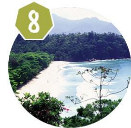
Trilha Praia Brava Almada - Ubatuba/SP 08/08