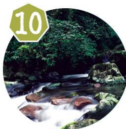
Traversia do Corisco 10/10 - 11/10