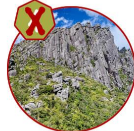
Traversia Marins x Itaguare 03/04 - 05/04