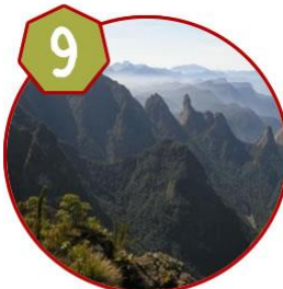
Traversia Serra dos Orgaos (Petro x Tere) 05/09 - 07/09