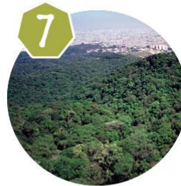
Trilha da Pedra Grande - São Paulo/SP 18/07