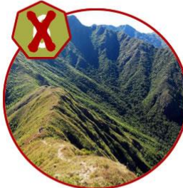
Traversia Serra Fina 04/06 - 07/06