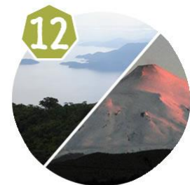
Pico São Sebastião - Ilhabela/SP Vulcão Villarica - Pucon/Chile 05/12 - 06/12 | 15/12