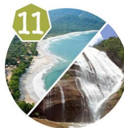
Trilha Praia de Castelhanos - Ilhabela/SP Cachoeira do Gato - Ilhabela/SP 31/10 | 02/11